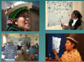
*Construcción y negociación de Régimen de Igualdad social y de género en la Carta Orgánica Municipal desde un enfoque descolonizador y despatriarcalizador.*